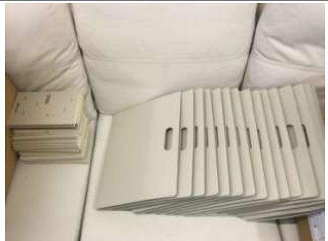
2016 台北雙年展記者會資料袋