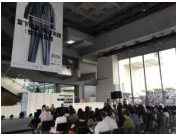
2016 台北雙年展記者會