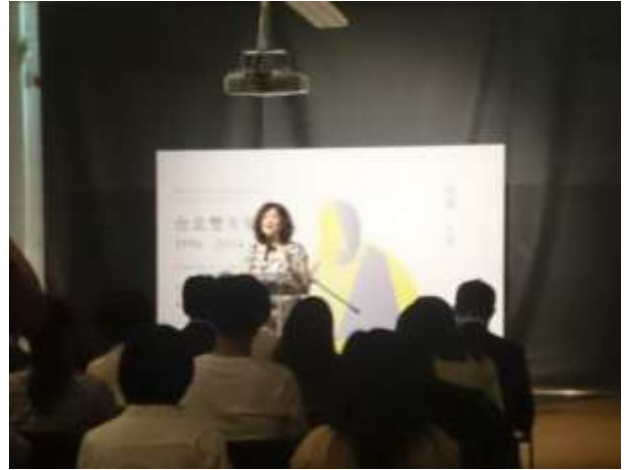
《朗誦/文件展》記者會