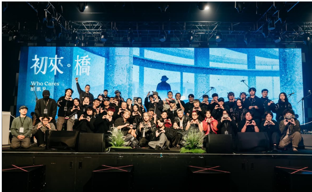
Who Cares 胡凱兒年度專場（票房：4000 人，實習生為前排右二）