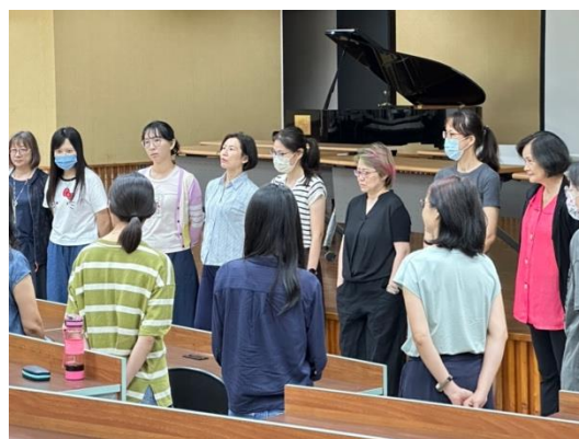
教學資源包研習馬拉松：譜出靈魂深處的歌