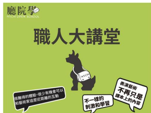
廳院學：職人大講堂