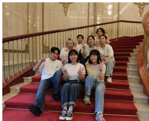
國家兩廳院實習十四班合照