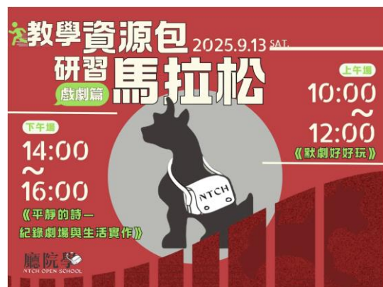
教學資源包研習馬拉松：戲劇篇