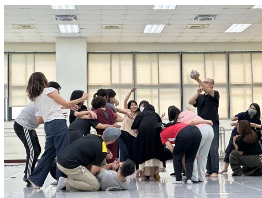
教學資源包研習馬拉松：默劇好好玩