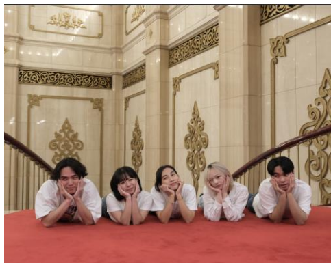
國家兩廳院公共溝通部實習生合照