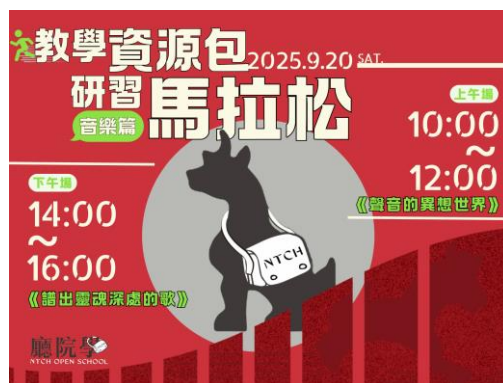
教學資源包研習馬拉松：音樂篇