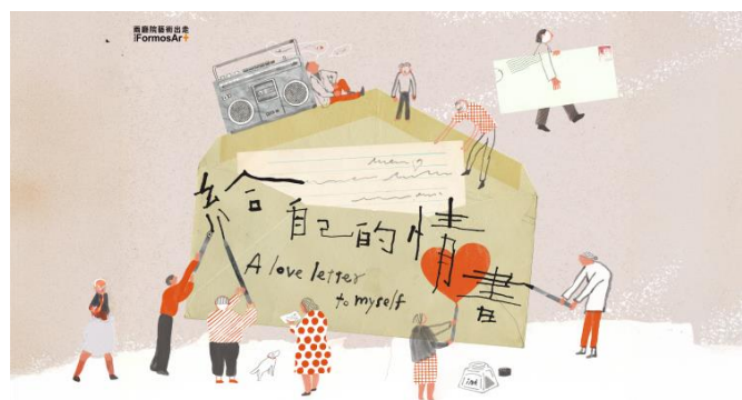
樂齡活動：給自己的情書