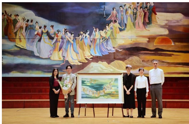
公共溝通部：樂天啟和致贈記者會