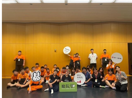
廳院學：一日體驗_柑園國中